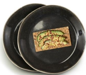
Kleiner Teller, grau, Keramik, ø 22 cm, 2er Set, 29,95 €

Unverbindlich empfohlene Verkaufspreise: